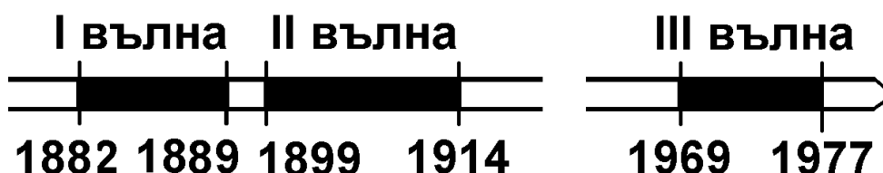
Фигура 1. Периодизация на обучението на българи в Морското училище и неговите наследници през XIX и XX век

В § 1.3. е обосновано изведена периодизацията в обучението в това военноморско учебно заведение (фиг. 1).