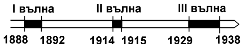
Фигура 3. Разположение по оста на времето на вълните от обучаеми българи във ВМУ – Ливорно

Той обхваща половин век – от 1888 до 1938 г., и се дели на три вълни (фиг. 3).